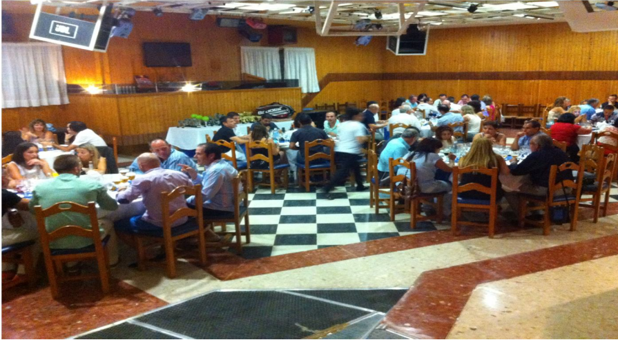
La cena fue el broche de la Temporada